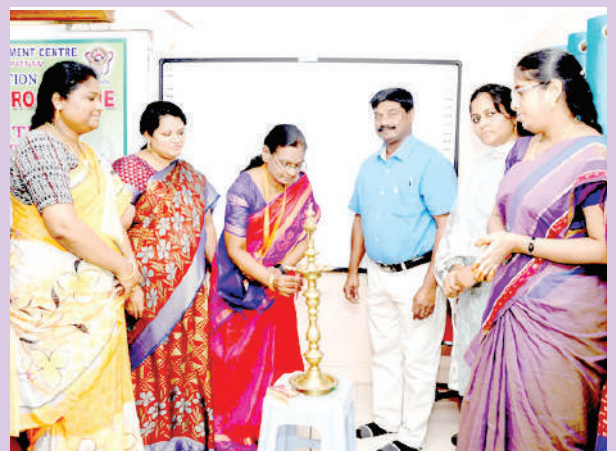
ఏయూ న్యూస్ , జూలై : భాష బలమైన ఆయుధంగా నిలుస్తుందని ఏయూ రెక్కార్ ఆచార్య కె.సమత అన్నారు. జూలై14 సాయంత్రం ఏయూ