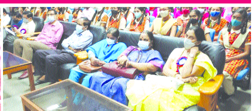
సైన్స్ వారోత్సవాలలో పాల్గొన్న ఆచార్యులు, పరిశోధకులు, విద్యార్థులు