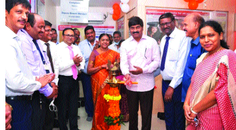
ఏయూ స్యూస్, ఫిబ్రవరి : ఆంధ్రప్రదేశ్ విద్యాలయం దూరవిద్యాకేంద్రం