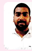
హుటకేశ్వరం, ఏయా పీజీ విద్యార్థి

మహిళలు, బాలికలపై దురాగతాలు జరిగితే వారి మర్యాదకు బంగం కలిగించేలా వ్యవహరిస్తే కేసు అతి తక్కువ సమయంలో విచారణ చేసి, శిక్ష పడేలా కొత్త చట్టాన్ని రూపొందించడం పట్ల హర్షం వ్యక్తం చేస్తున్నారు. ఆంధ్ర ప్రదేశ్ దిశ చట్టం 2019లో ఆపదలో ఉన్న వారిని ఆదుకోనేందుకు దిశ యాప్ రూపకల్పన చేశారు. ప్రభుత్వం దిశ పోలీసు స్టేషన్లు కూడా ఏర్పాటు చేయడం అభినందనీయం. ఇది మహిళలకే కాకుండా పురుషులకు కూడా ఉపయోగపడుతుంది. ప్రమాదాలకు గురైనా, ఎవరైనా మనపై దాడి చేసినా దిశ యాప్ నే సమాచారం అందిస్తే పోలీసులు స్పందించి, చర్యలు తీసుకుంటారు.