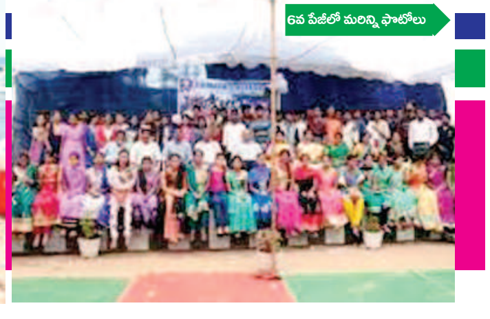
6వ పీజీలో మరిన్ని ఫాటోలు