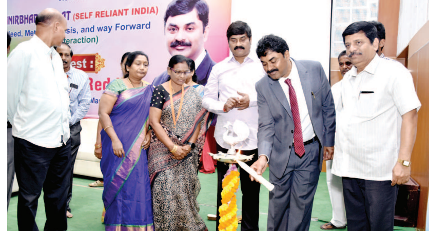
అలోచనలతో వస్తే ప్రోత్సహించడానికి, తగిన ఆర్థిక సహకారం అందించడానికి తాము

ఏయూ న్యూస్, సెప్టెంబర్ : విశ్వవిద్యాలయాలు నవ్య ఆవిష్కరణలకు వేదికలుగా నిలుస్తాయని భారత రక్షణమంత్రి సాంకేతిక సలహాదారు డాక్టర్ జి.సతీష్ రెడ్డి అన్నారు. బుధవారం ఏయూ వైవిఎన్ మూర్తి ఆడిటోరియంలో ఆయన విద్యార్థులను ద్వేషించి అత్యున్నత భారత్ అంశంపై ప్రసంగించారు. దేశం ఆర్థికంగా పురోభివృద్ధి సాధించాలంటే మనం అడ్వాన్స్ టెక్నాలజీలలో పనిచేయడం ఎంతో అవసరమన్నారు. యువత నూతన